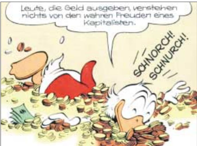
Die Diskussion um überschämte Managergehälter kann ihm nichts anhaben. Dagobert Duck ist der Prototyp eines Raubtierkapitalisten.

(Alle Zitate sind Übersetzungen von Dr. Erika Fuchs. Quelle: Duckipedia)