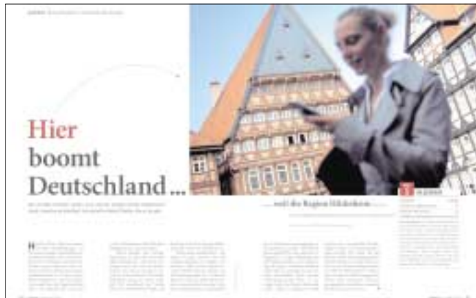
So berichtet das Unternehmerrmagazin Impulse in der aktuellen Ausgabe.

Das hatte Folgen: Der Verlust von sicheren Arbeitsplätzen und eine dadurch mäßige Lohnentwicklung