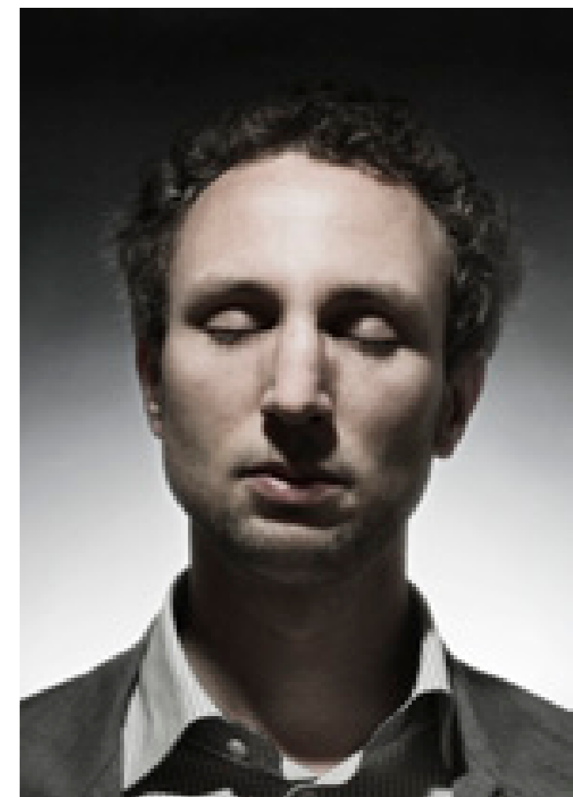
EKD 2012 Reformation und Musik Foto Lothar Veit Fotos Seite 69 Marina Rosso